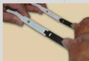
Clipser les deux tringles pour le kit MANUEL