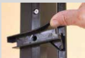
Soulever la languette de support de lame pour introduire les lames.