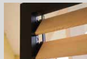
Votre panneau fini, lames ouvertes.