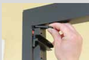
Positionnement du kit SAM avec cale de 7mm en partie haute du support.

UN RESULTAT ESTHETIQUE AVEC UN MONTAGE SIMPLE & RAPIDE.