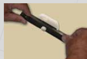
Insérer le loquet et le tourner dans le sens horaire pour le kit MOTORISE