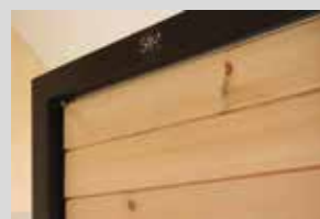
Votre panneau fini, lames fermées.