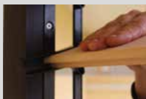
Pousser les lames dans leurs logements.